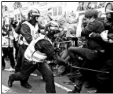
Стычки на улицах Лондона

В общей сложности было задержано не менее 214 граждан, сообщает сайт www.ayda.ru .